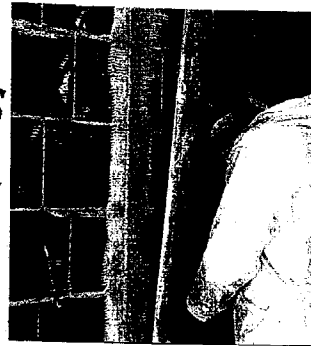
1 Mise en place des nus

Afin d'obtenir une meilleure planéité de la surface enduite, il est possible de réaliser des nus sur le support. Le nu est une bande de plâtre, d'une largeur de 4 cm environ, couvrant toute la hauteur de la cloison. Son épaisseur doit correspondre à l'affleurement de l'enduit. Il est réalisé à l'aide d'une règle que l'on enlève une fois que le plâtre a fait sa prise. Le nu, en guidant la règle lors du réglage, sert à garantir l'épaisseur de l'enduit, sa verticalité, sa planéité.