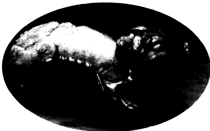
Tigre, Royaumes des combattants (770-221 av. J.C.)