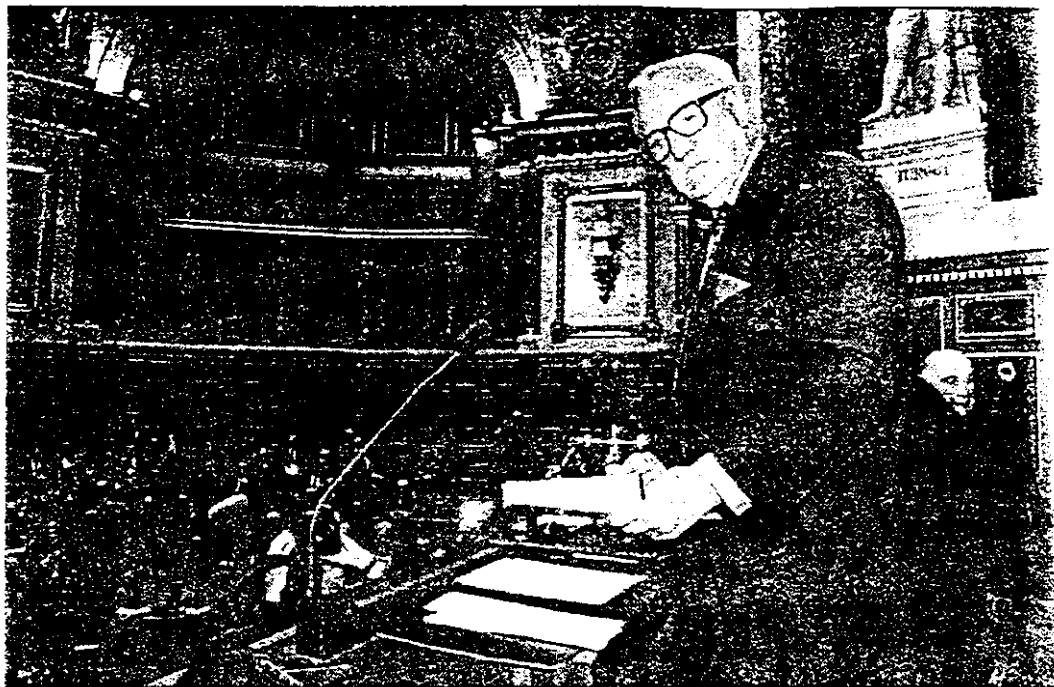
Christian Poncelet: «Le Sénat doit résister à la tentation du toujours oui ou toujours non».

Après avoir devancé René Monory au premier tour, puis Daniel Hoeffel au second, le RPR Christian Poncelet a été élu président du Sénat au troisième tour de scrutin. Il a recueilli 189 voix sur les 320 sénateurs votants. (Louis Le Pensec , toujours ministre de l'Agriculture, ne participait pas au vote).