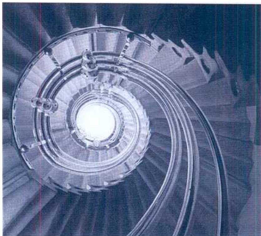
Document 3 - Cage d'escalier d'une maison de Londres d'après Architecture intérieure n° 210 - 1986

Projets du peintre François ROUAN d'après Céramique et Verre n° 104 - 1999