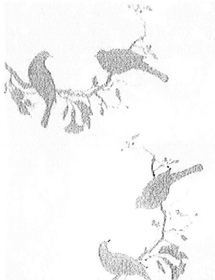
Document sticker :