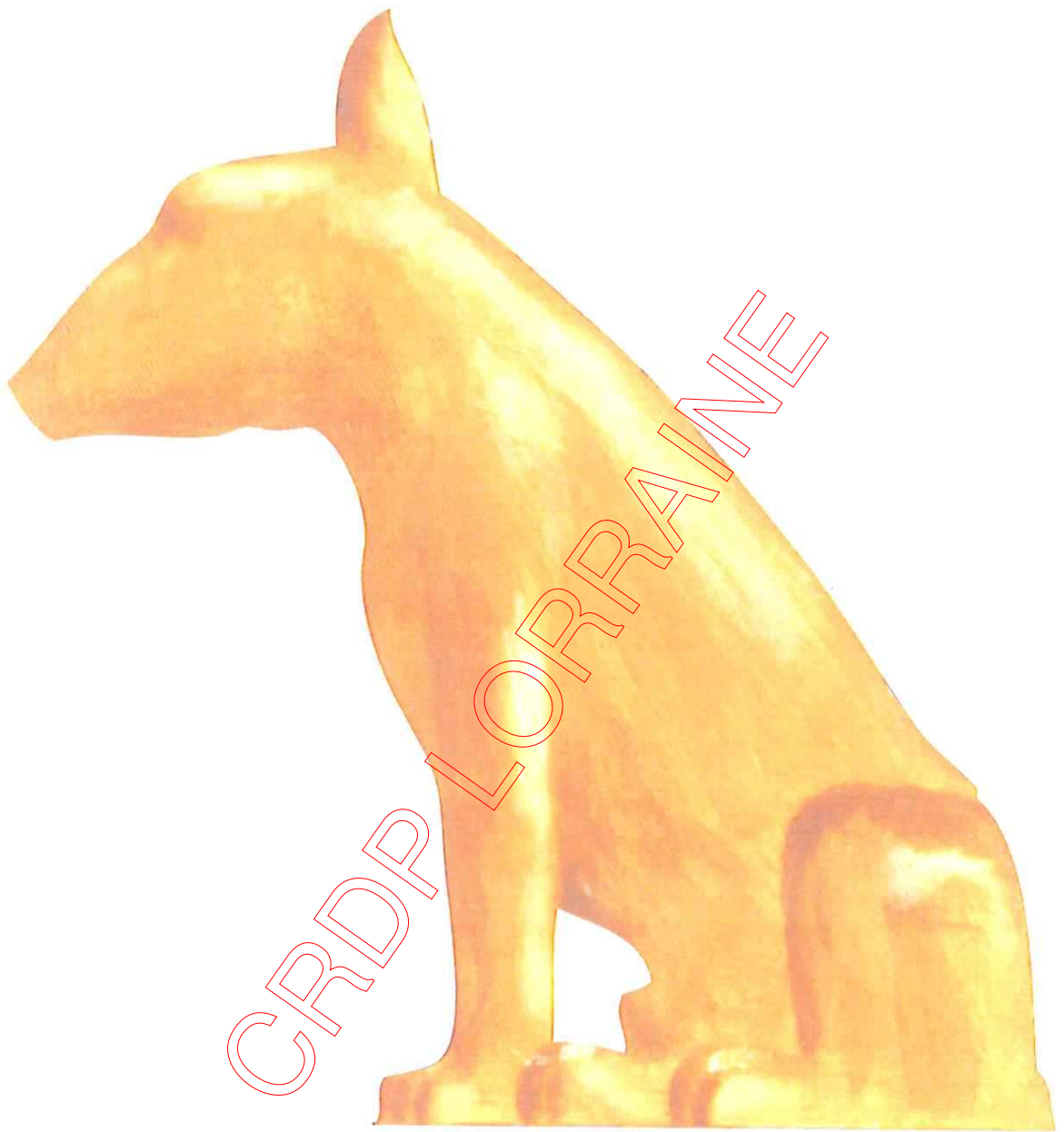
Modèle de l'attribut