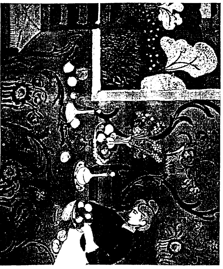
Matisse "La desserte rouge" (Huile sur toile 180 x 220 cm)