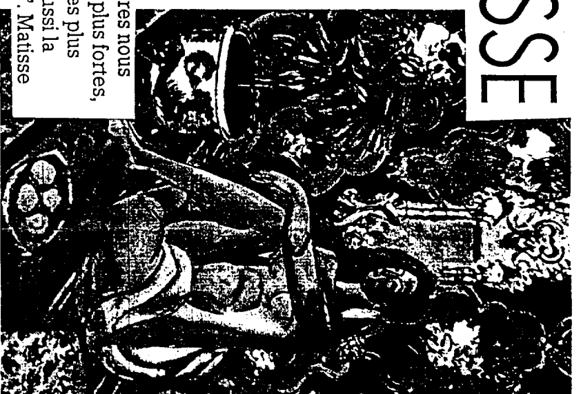
Matisse Figure décorative sur fond ornemental (1927 - Huile sur toile, 130 x 98 cm - Paris, Musée d'Art Moderne)

"... avec des couleurs pures nous obtenions des réactions plus fortes, des réactions simultanées plus évidentes : et il y avait aussi la luminosité des couleurs". Matisse