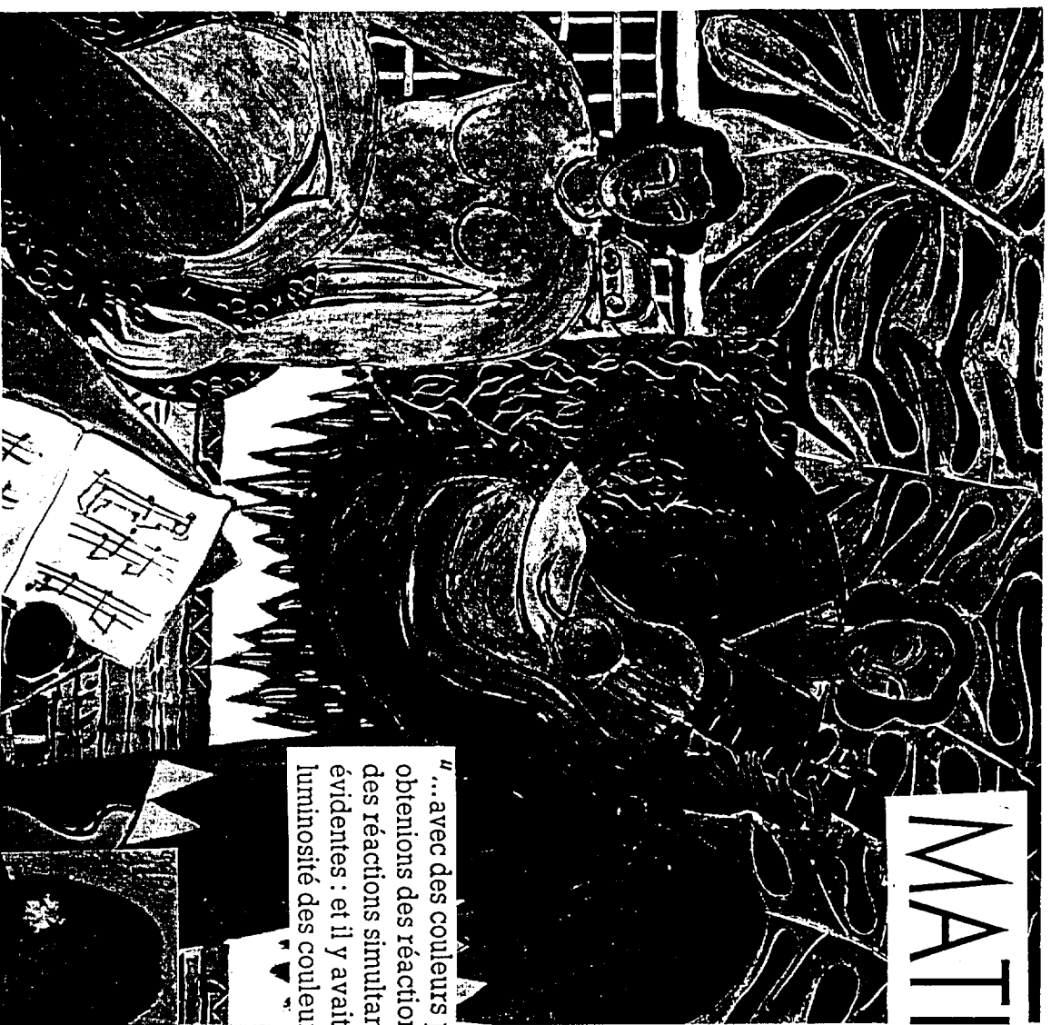
Matisse LA MUSIQUE 1939 - Huile sur toile, 115 x 115 cm - Buffalo, Albright-Knox Art Gallery

"... avec des couleurs pures nous obtenions des réactions plus fortes, des réactions simultanées plus évidentes : et il y avait aussi la luminosité des couleurs". Matisse