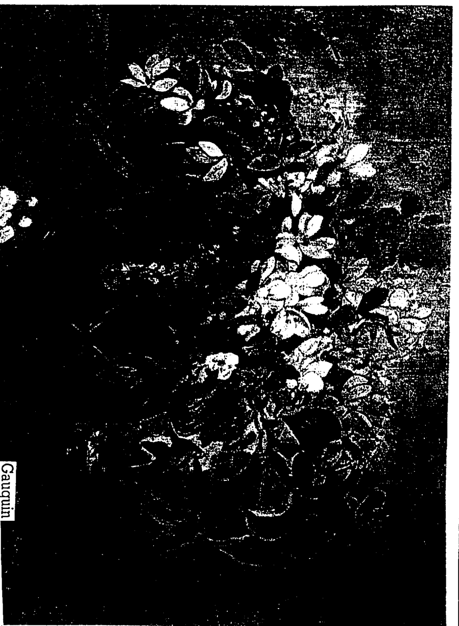
Gauguin Vase de fleurs rouges, 1896 Huile sur toile, 63 x 73 cm Londres, National Gallery of Art