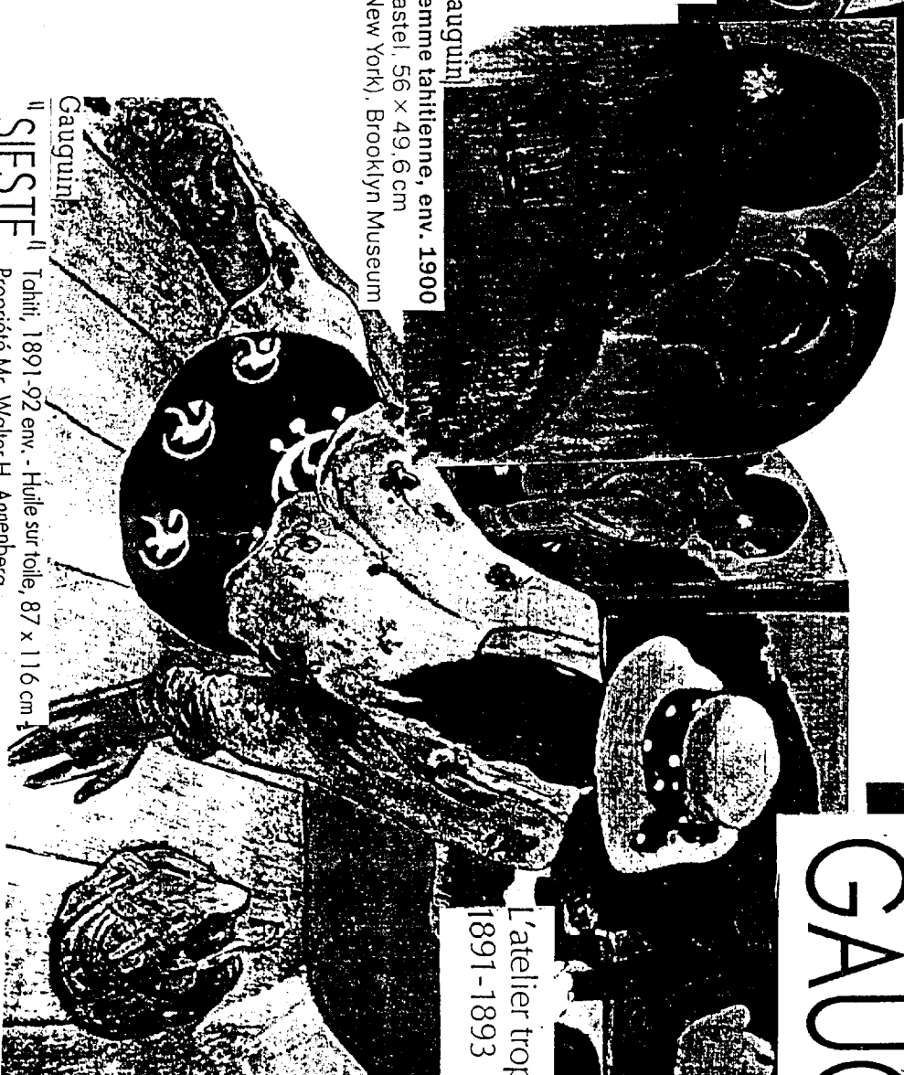
L'atelier tropical à Tahiti 1891-1893