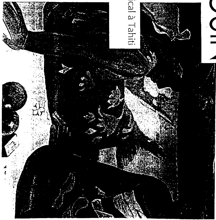
Gauguin «Quelles nouvelles?», 1892 «Parau Api» Huile sur toile, 67 x 91 cm