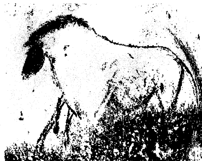
GROTTE CHAUVET PONT-D'ARC (Ardèche)

Les plus anciennes peintures préhistoriques du monde.