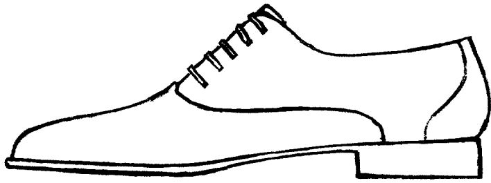
Modèle de type « RICHELIEU » homme classique